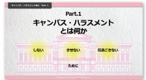
▲コンテンツ動画のイメージ ～Part.1 キャンパス・ハラスメントとは何か～

受講環境は、PC、タブレット、スマートフォンなど、機器やブラウザの制限がなく、いつでもどこからでも、ご自身で時間を取ってご受講いただけます。